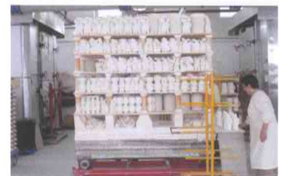
8.- BIZCOCHO, primera cocción de la pieza a 800 °C para poderla manipular, decorar y aplicar el baño o vidriado,