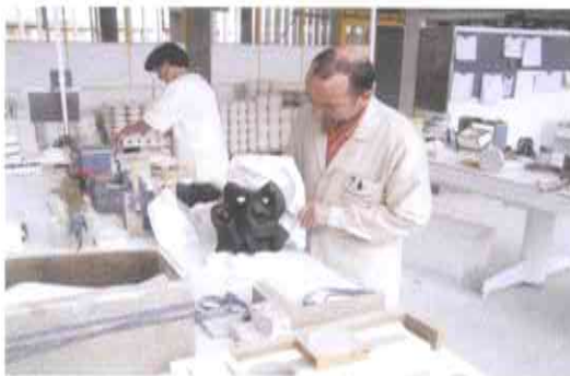
3.- ELABORACIÓN DE MOLDES DE ESCAYOLA A PARTIR DE LOS MODELOS.