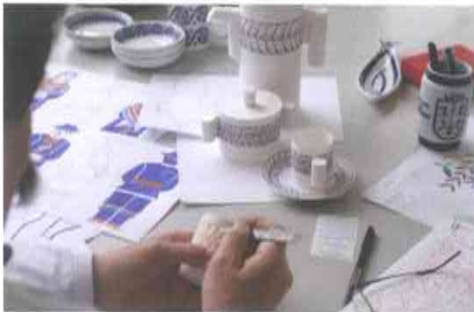
2.- DISEÑO, CREACIÓN Y PRODUCCIÓN DE PROTOTIPOS O MODELOS.