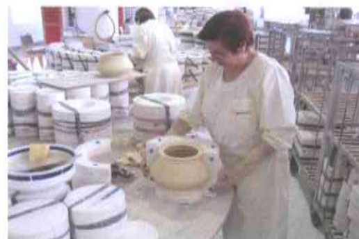
6.- DESMOLDEANDO, una vez colada y vaciada la pasta.