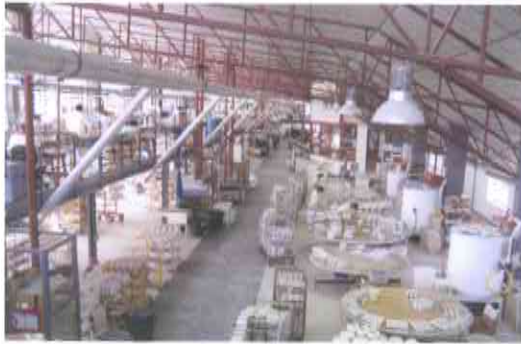
1.- VISTA GENERAL DE LA PLANTA DE PRODUCCIÓN.