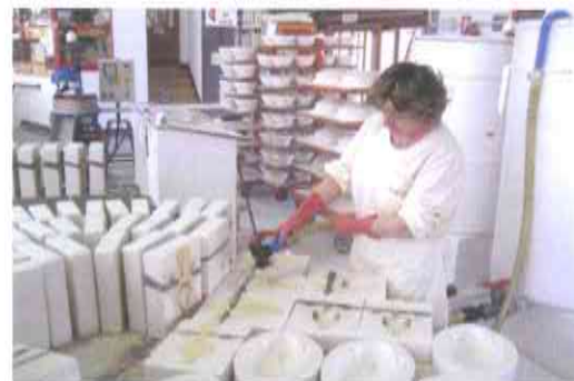
5.- REPRODUCCIÓN POR COLADO CON PASTA LÍQUIDA, llenando los moldes de escayola, que absorben agua formando una corteza con la forma de la pieza.