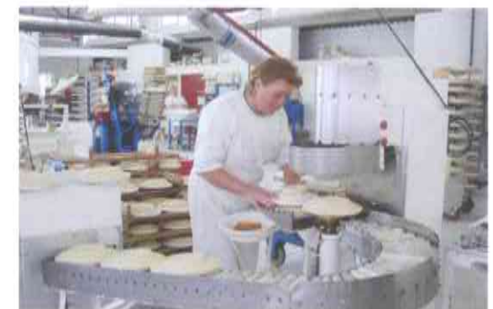
7.- REPRODUCCIÓN POR CALBRADO, modelado mecánico sobre molde, con pasta plástica.