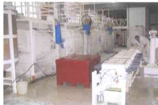
4.- PREPARACIÓN DE PASTAS Y VIDRIADOS, a partir de caolín, cuarzo, feldespato y agua, molienda, filtración y amasado.