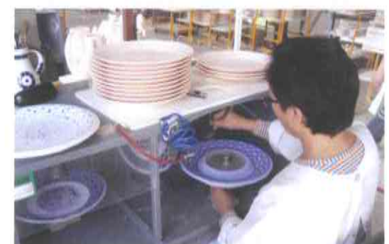
9.- DECORACIÓN BAJO CUBIERTA, las piezas bizcochadas son decoradas a mano con plantillas y aerógrafos.