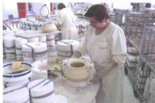
6.- DESMOLDEANDO, unha vez colada e vaciada a pasta.