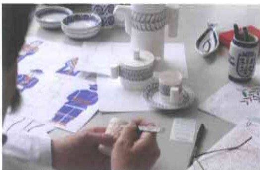
2.- DESEÑO, CREACIÓN E PRODUCCIÓN DE PROTOTIPOS OU MODELOS.