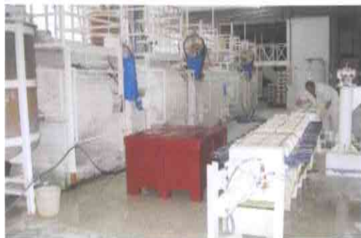
4.- PREPARACIÓN DE PASTAS E VIDRADOS, a partir de caolín, cuarzo, feldespato e auga, moenda, filtración e amasado.