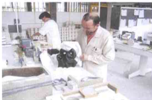
3.- ELABORACIÓN DE MOLDES DE ESCAIOLA A PARTIR DOS MODELOS.