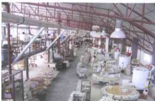
1.- VISTA XERAL DA PLANTA DE PRODUCCIÓN.