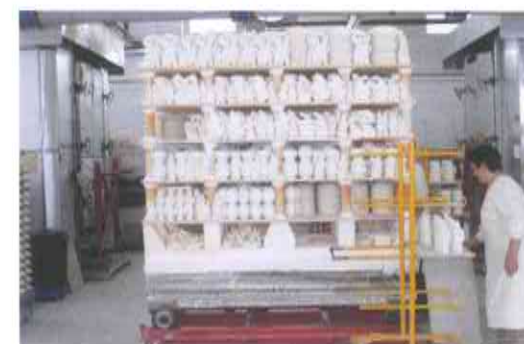
8.- BISCOITO, primeira cocción da peza a 800 °C para podela manipular, decorar e aplicar o baño ou vidrado.