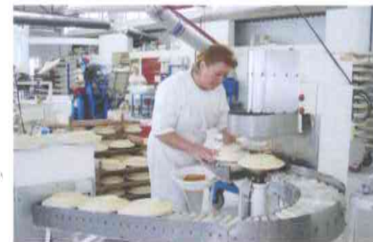
7.- REPRODUCCIÓN POR CALIBRADO, modelado mecánico sobre molde, con pasta plástica.