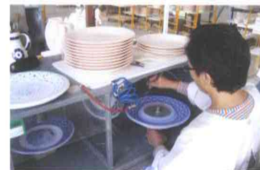
9.- DECORACIÓN BAIXO CUBERTA, as pezas biscoidadas son decoradas á man con plantillas e aerógrafos.