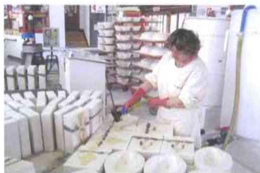
5.- REPRODUCCIÓN POR COLADO CON PASTA LÍQUIDA, enchendo os moldes de escaiola, que absorben auga formando unha cortiza coa forma da peza.